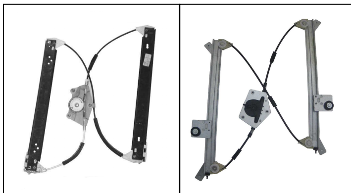
Alzacristallo originale – oem window regulator – lève-vitre original – Fensterheber von oem – elevalunas original – levandator de vidro original orijinal cam acacagi - Γρύλος γνήσιος